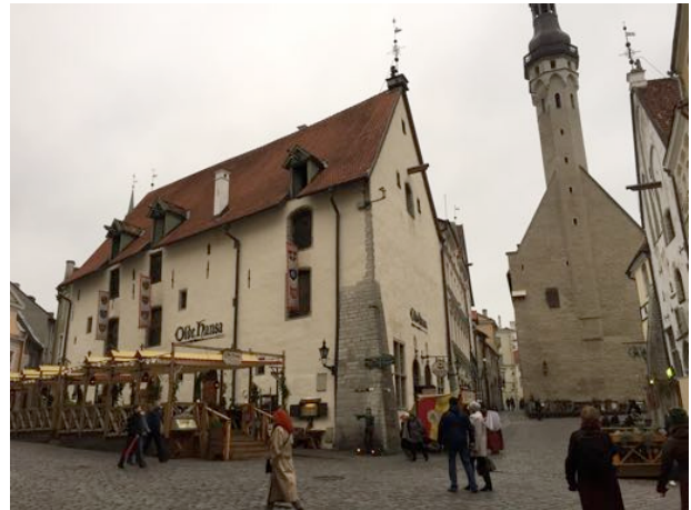
Old Hanse in Tallinn