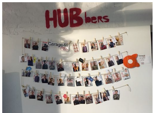
Garage 48 HUB and Coworking Place