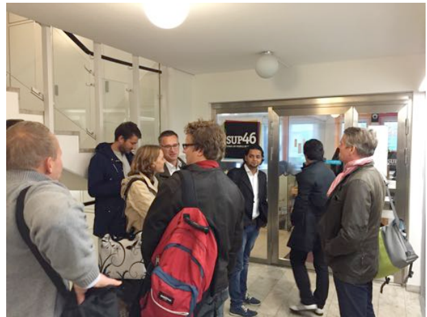
@SUP46 in the City of Stockholm