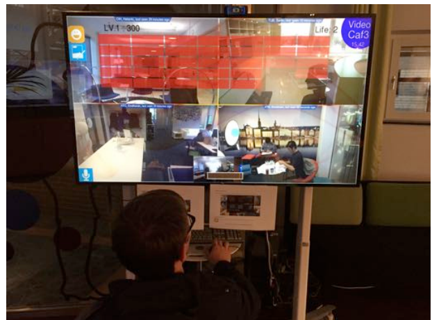
EIT ICT Lab in Kista