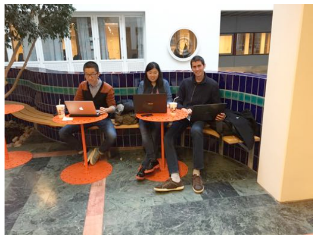
IT University in Kista